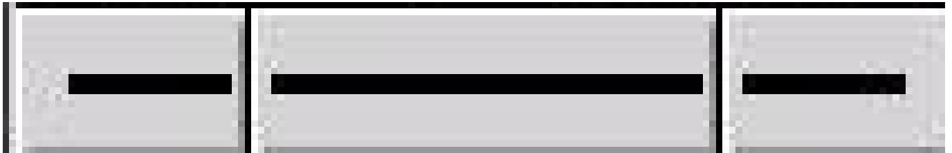
Figure 3.3: Marraren propietateak

Marrak erraz edita daitezke geziak eta horrelako elementuak sortzeko. Tresna-koadroaren behealdean 3 botoi daude marrekin. Klik egin eta sakatuta edukita, menu bat azalduko da aldaketaren emaitza ikusteko.